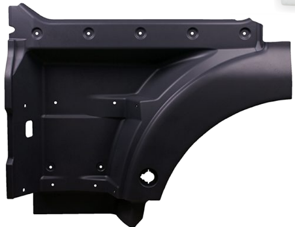
obudowa stopnia kabiny