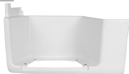
obudowa stopnia kabiny