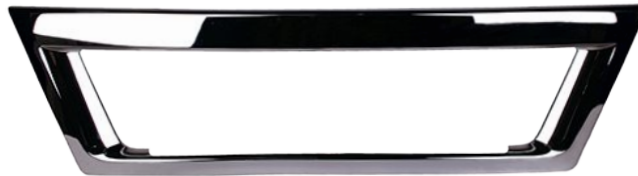
ramka zderzaka przedniego