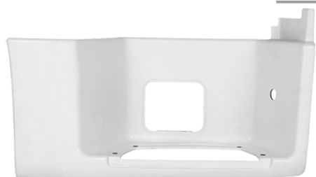
obudowa stopnia kabiny