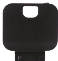
zaślepka obudowy stopnia