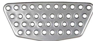
płyta stopnia kabiny (środkowa)