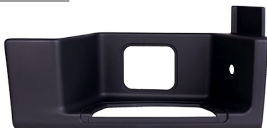
obudowa stopnia kabiny prawa