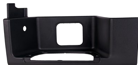
obudowa stopnia kabiny lewa