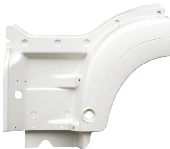
obudowa stopnia kabiny