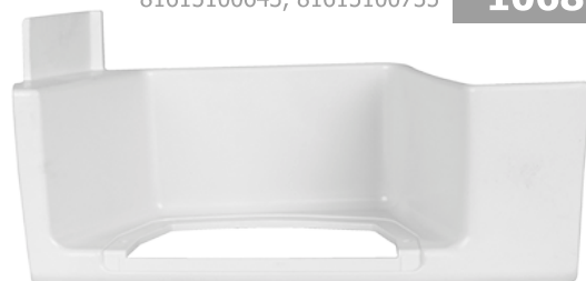
obudowa stopnia kabiny lewa