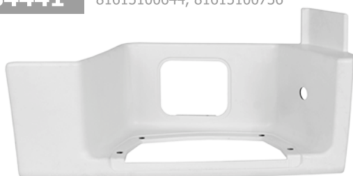
obudowa stopnia kabiny prawa