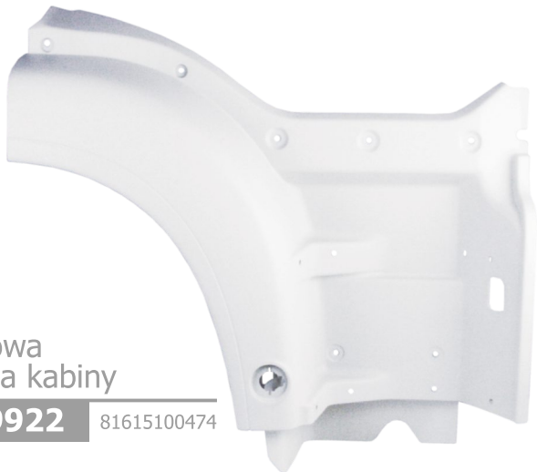
obudowa stopnia kabiny