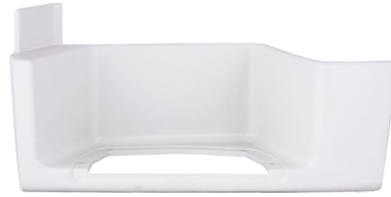
obudowa stopnia kabiny