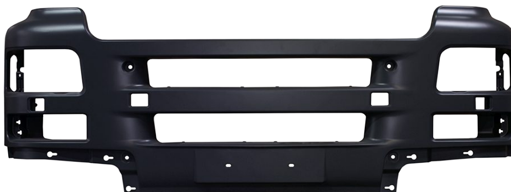
zderzak przedni szary