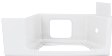
obudowa stopnia kabiny