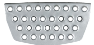
płyta stopnia kabiny, dolna