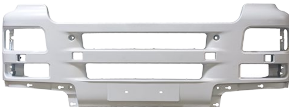
zderzak przedni biały